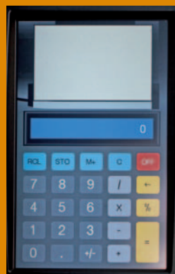
Calcolatrice con stampa