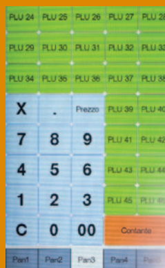
5 pagine programmabili