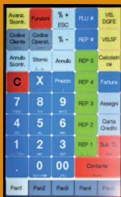
Fino a 125 tasti diretti